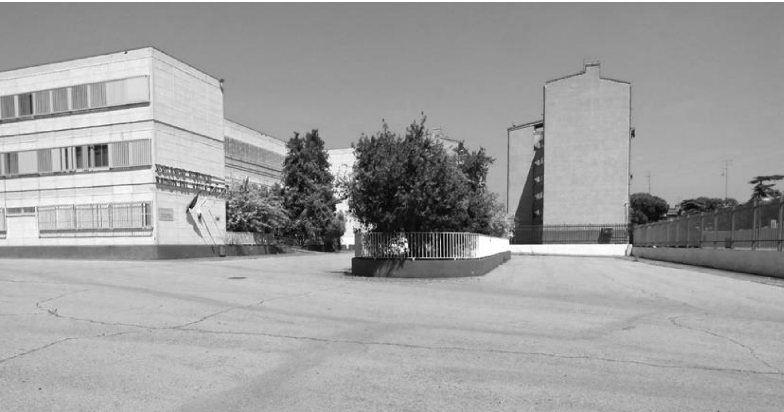
1ª Conferencia Iberica de Adaptación al Cambio Climático – 18 noviembre 2020